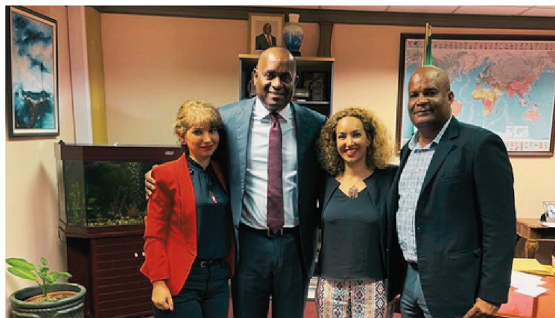
جلسه مدیران کنکاش در دفتر نخست وزیر با جناب آقای روزولت اسکریت نخست وزیر دومینیکا و جناب آقای امانوئل نانتان رئیس واحد اعطای شهروندی دومینیکا

پاسپورت‌ها و گواهی‌های شهروندی همه اعضای خانواده همزمان در دفتر کنکاش به متقاضی تقدیم خواهند شد. هیچ‌گونه سفر و یا مصاحبه، دانش زبان یا دانش مدیریت برای این اقدام نیاز نیست.