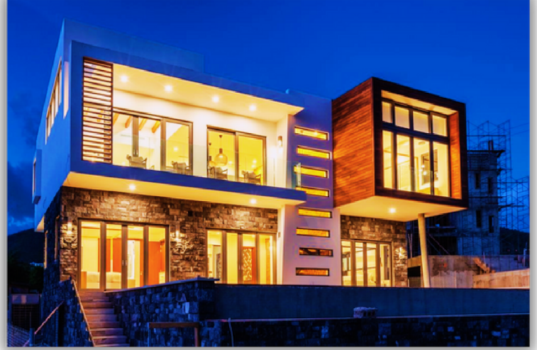
یکی از ویلاهای تکمیل شده پروژه هتل هیلتون