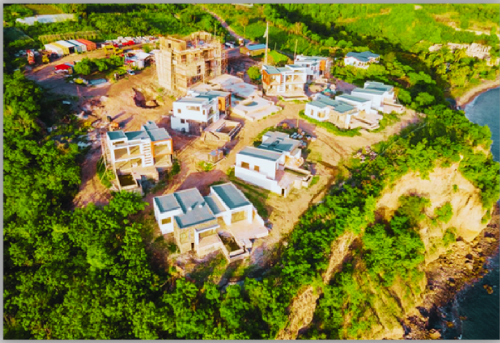
پروژه در حال ساخت هتل هیلتون در دومینیکا